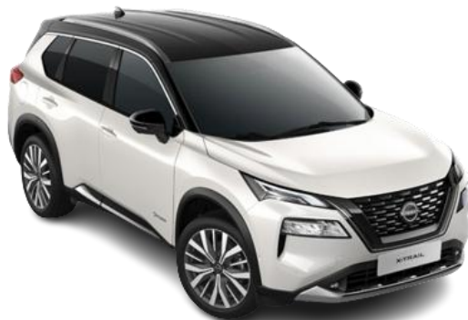
Biały perłowy + Czarny dach XBJ | 6 200 zł

*Wersja N-Trek dostępna w lakierach dwukolorowych XEW, XEX, XBJ