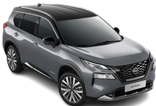
Szary ceramiczny + Czarny dach - XEX | 6 200 zł