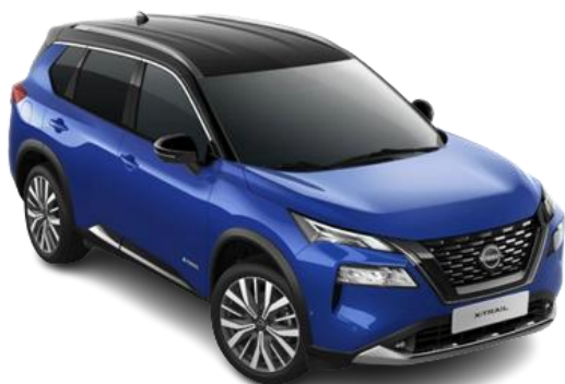
Niebieski + Czarny dach XEU | 6 200 zł