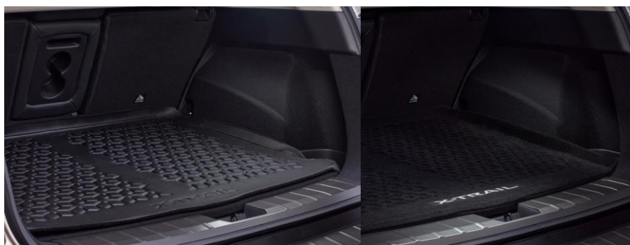
Dwustronna mata bagażnika