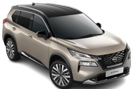
Szampański + Czarny dach XEW | 6 200 zł